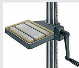
TP: 350 x 250 mm Table pivotante