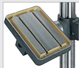
TC: 350 x 250 mm Table pivotante étau